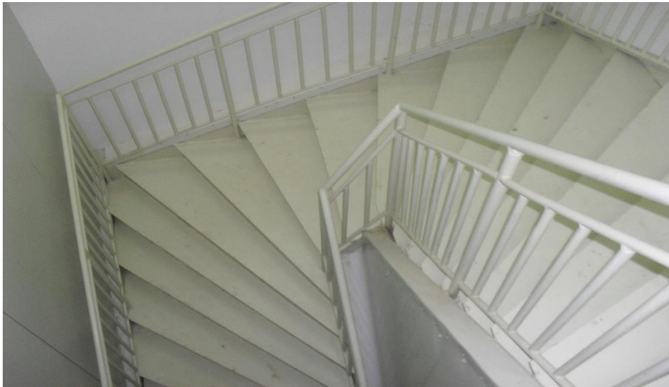
Scari acces etaj