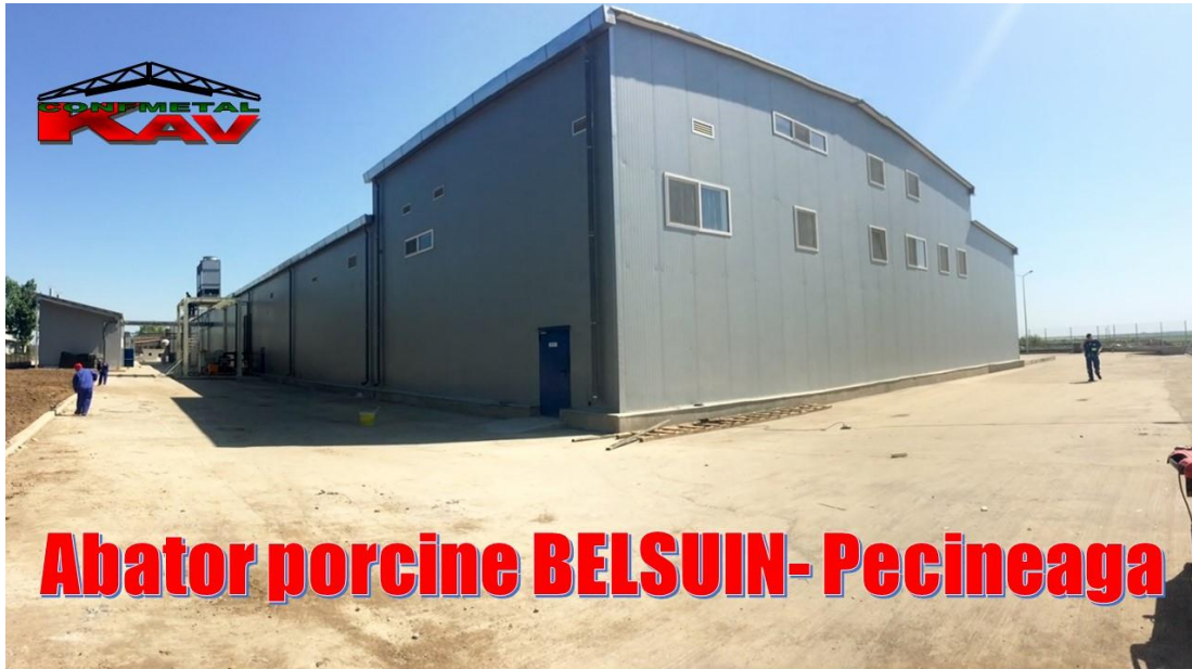
Abator BELSUIN – Pecineaga – vedere din fata