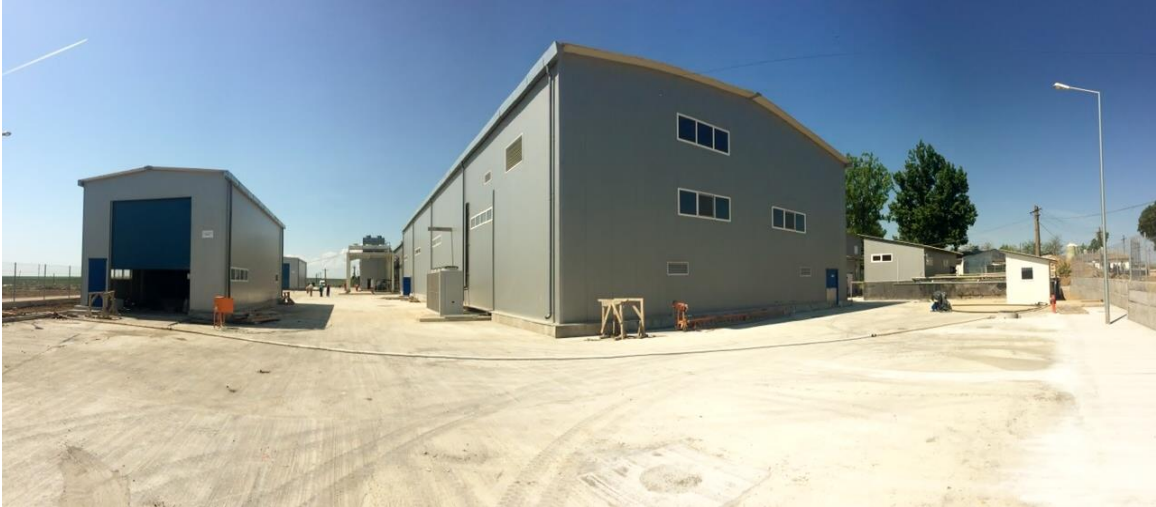
Abator BELSUIN – Pecineaga – vedere din spate