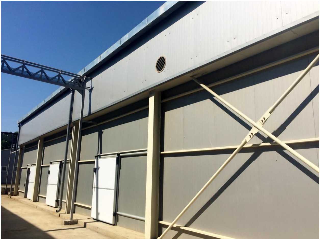
Depozitul de deseuri animaliere