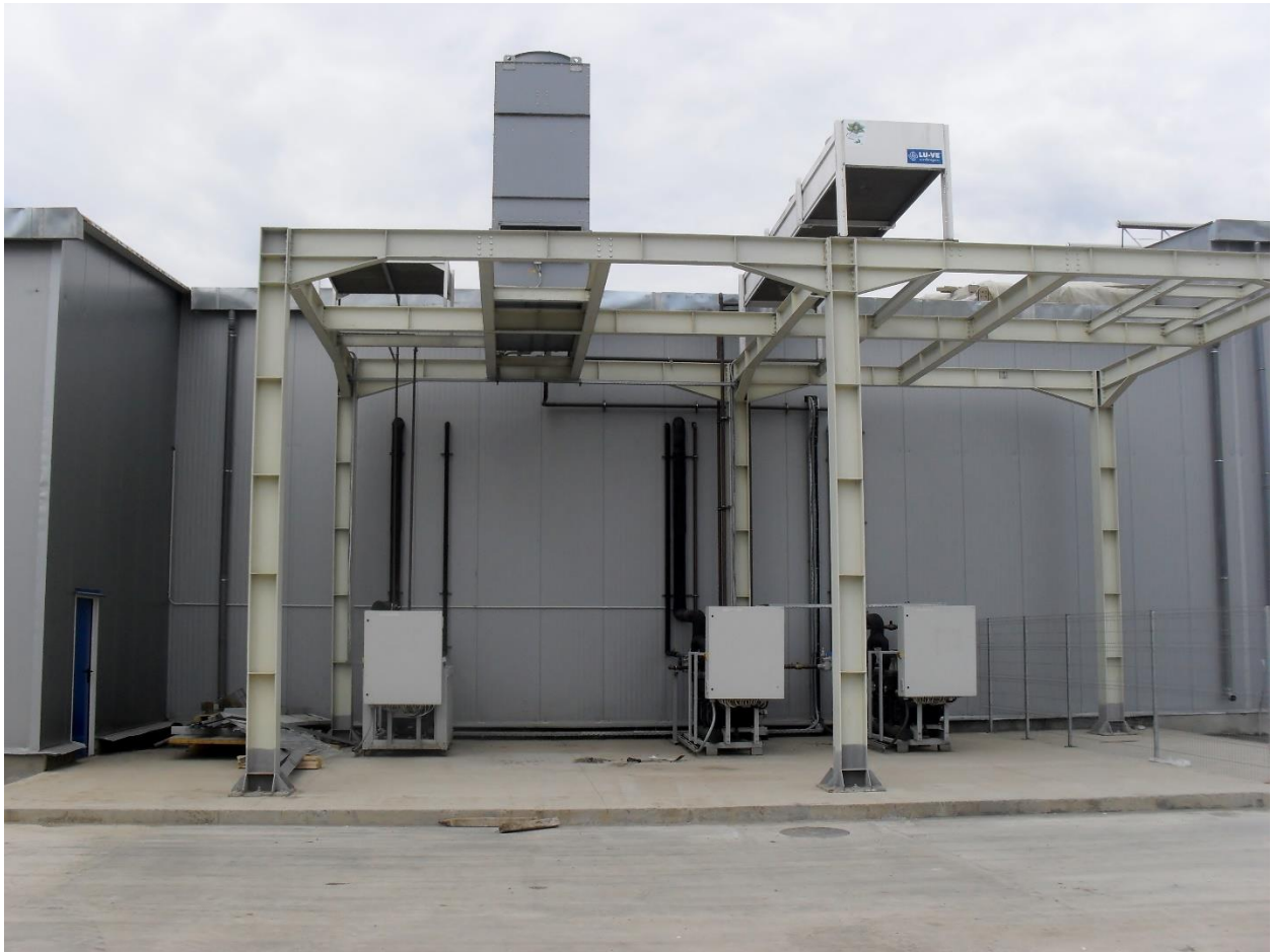
Platforma sustinere utilaje racire