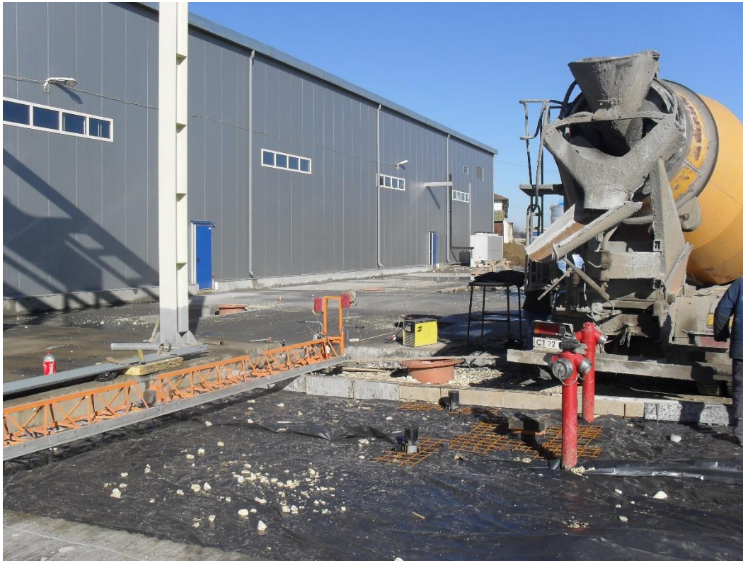
Turnare beton platforma exterioara