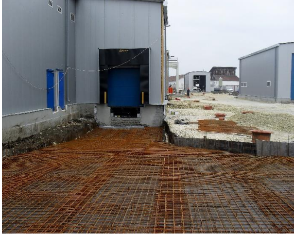
Zona rampe de livrare - in faza de constructie