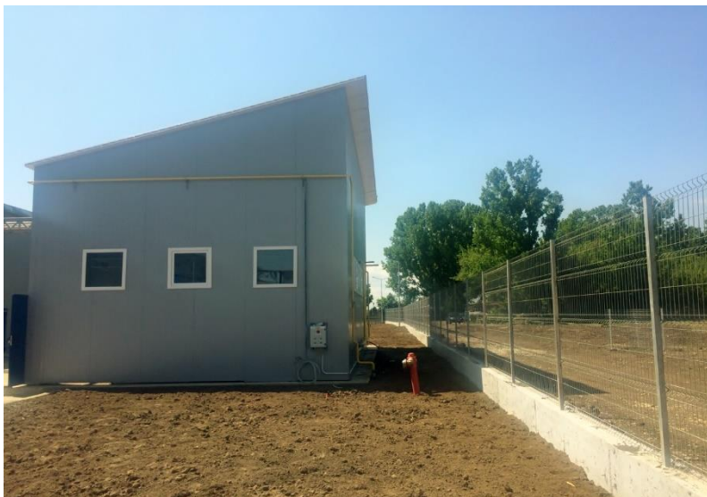
««« Centrala termica