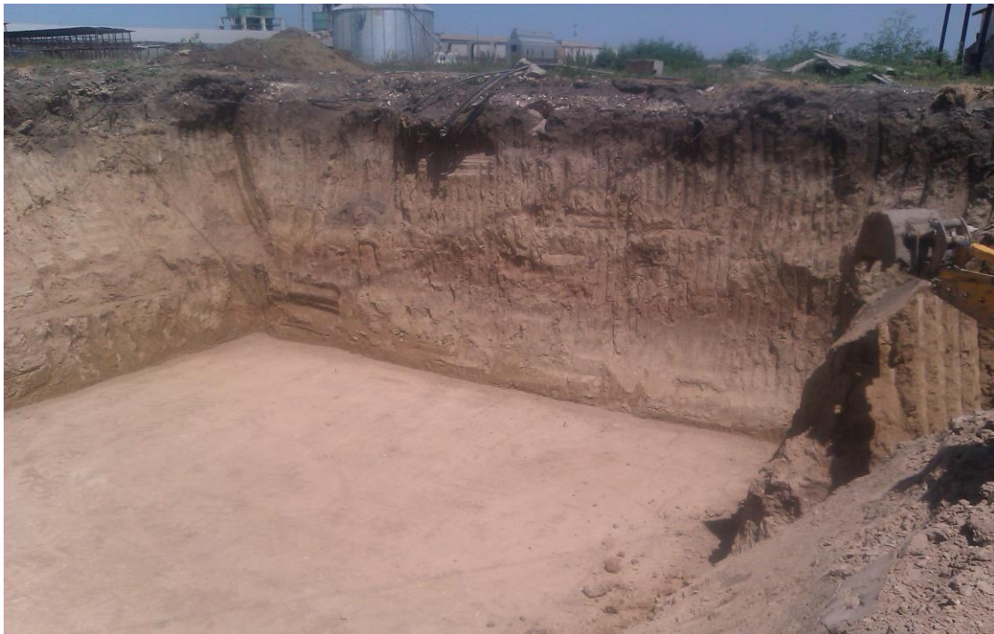
Excavare statia de epurare