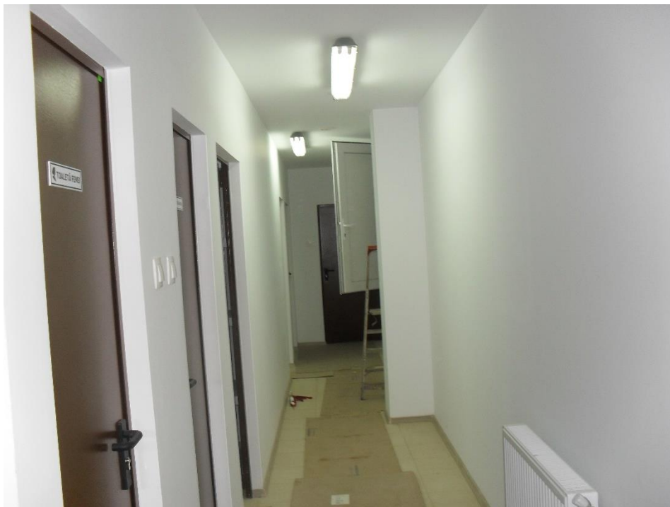
Hol de acces toalete personal