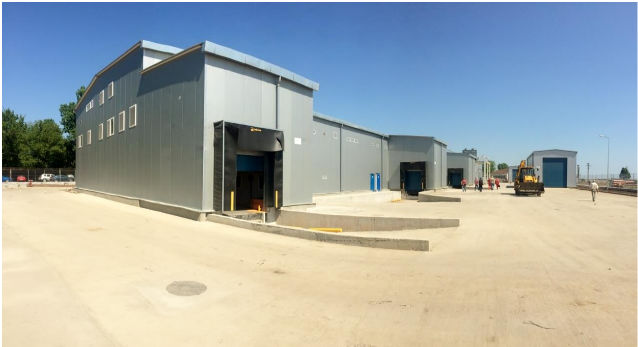
Zona rampe de livrare - finalizata