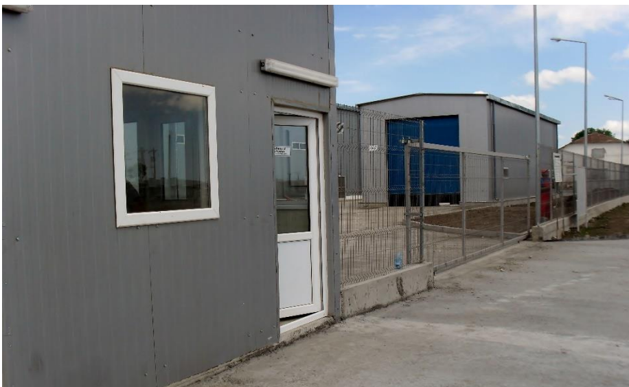
Cladire filtru acces personal