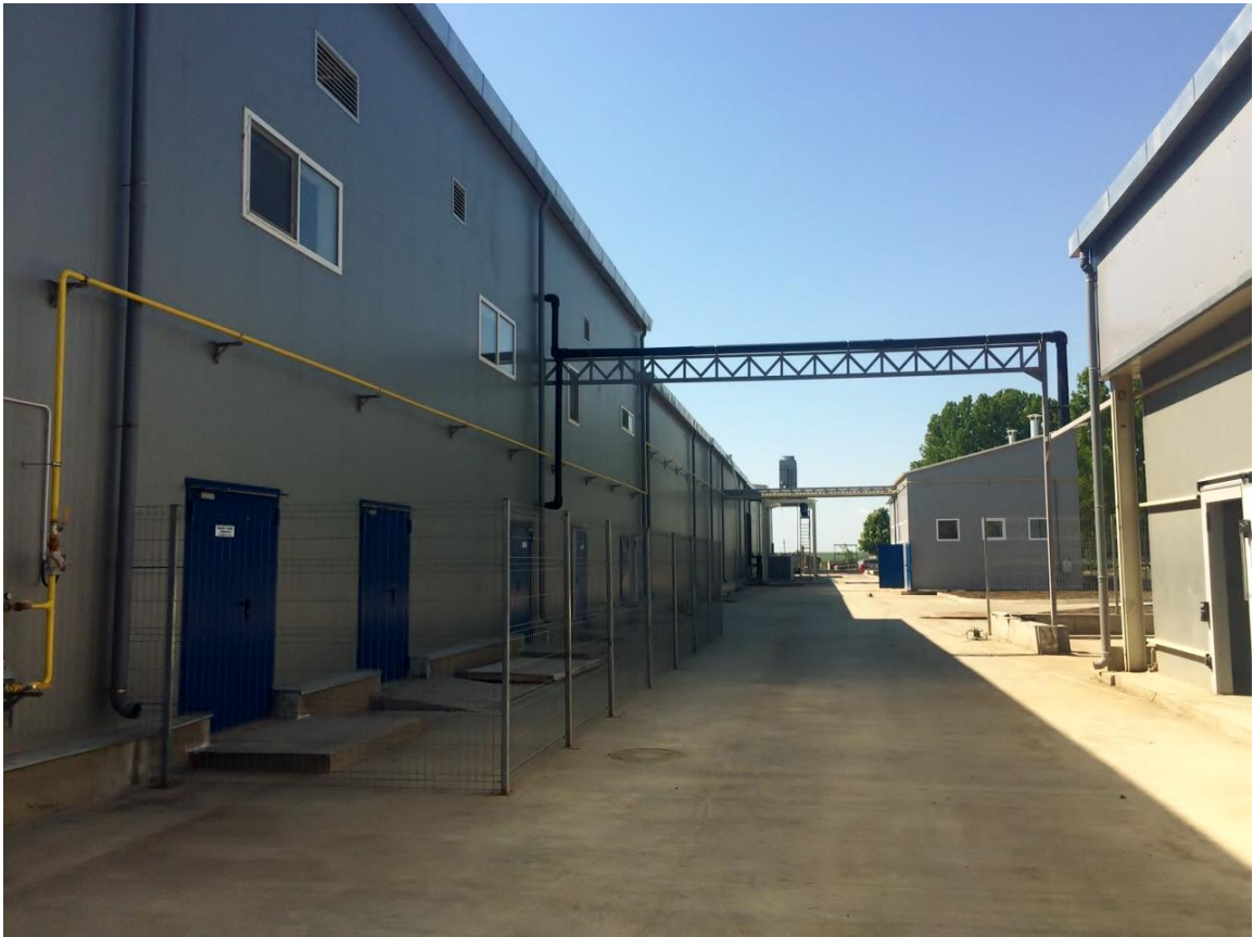
Detalii exterioare abator