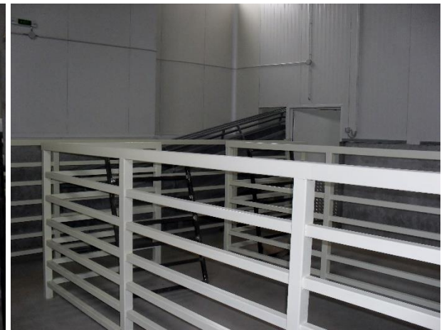
Interior - zona acces animale vii pentru sacrificare