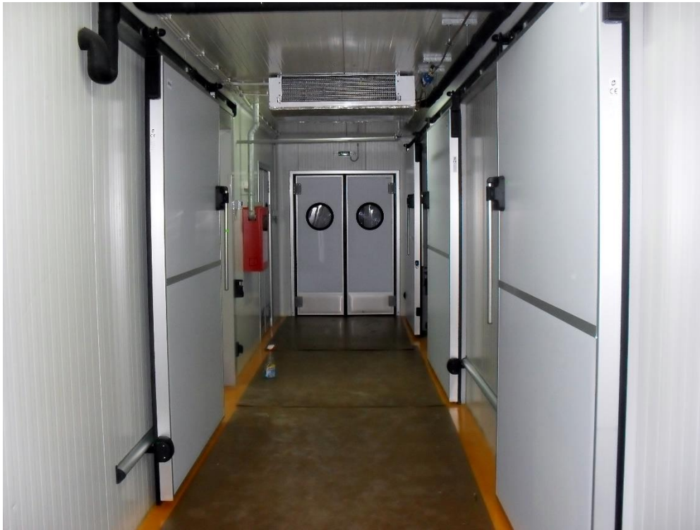
Hol acces spatii frigorifice