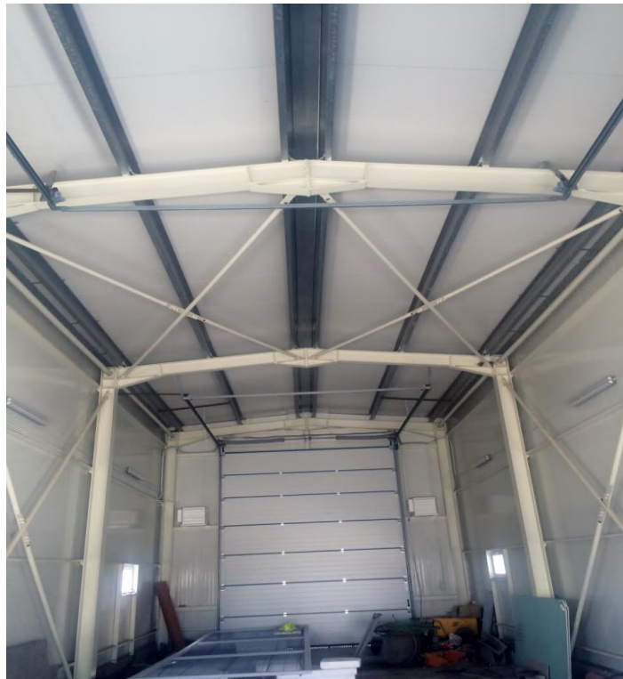
Interior rampa de spalare camioane