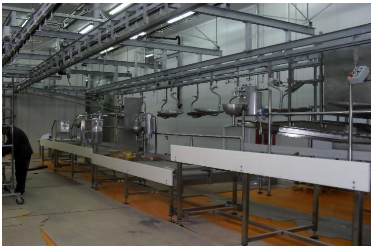
Zona de abatorizare