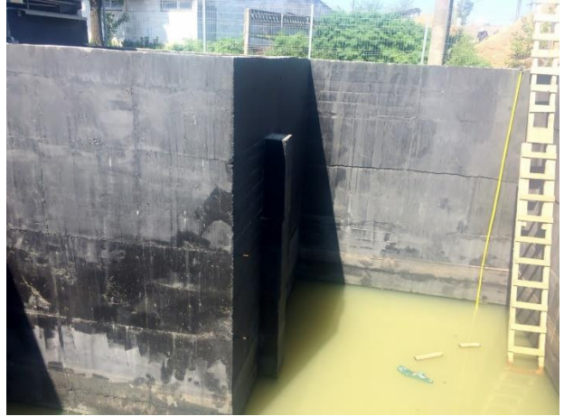
Statie de epurare