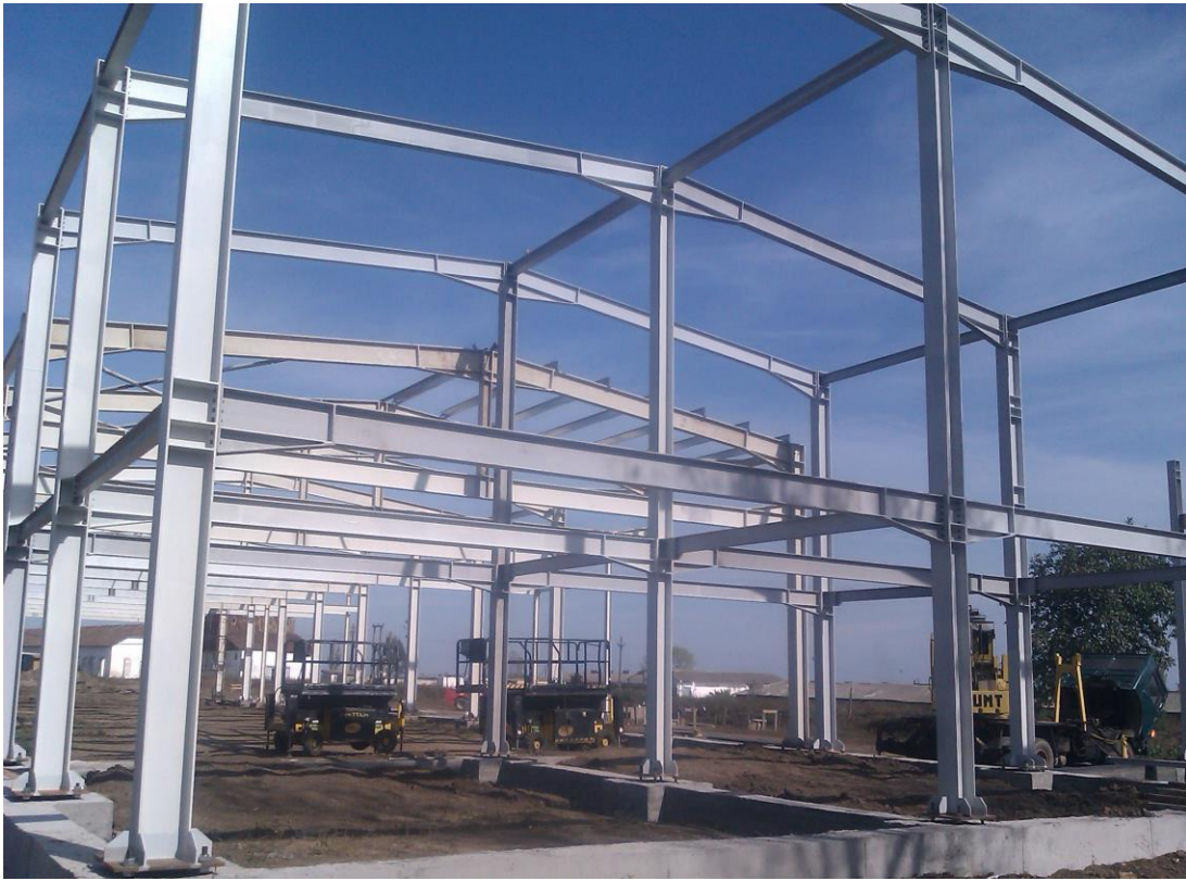
↑Faza montaj structura metalica↓