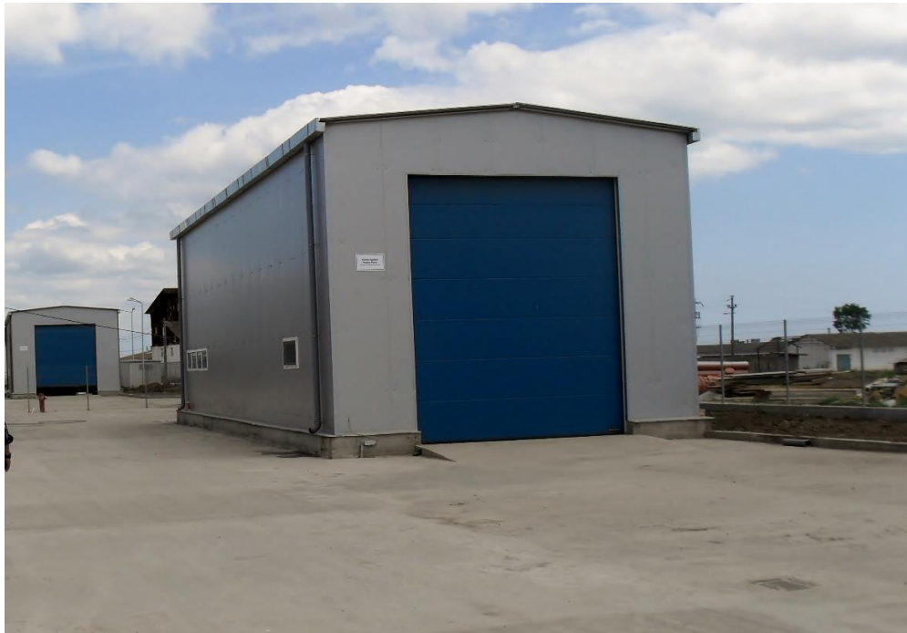
Cladiri rampe spalare camioane